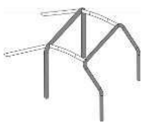
1 arco principal 1 rollbar frontal 2 membros longitudinais 2 apoios traseiros (backstays)

A viatura terá de ter uma estrutura imediatamente atrás do banco do piloto e copiloto que seja mais larga do que os seus ombros e se estende acima deles quando o piloto está sentado normalmente com os cintos colocados.