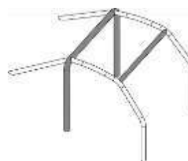
1 arco principal 2 barras laterais dos meios aros 1 membro transversal 2 apoios traseiros (backstays)

4.2 - A viatura de referência permitirá verificar a conformidade da viatura de competição a qualquer momento.