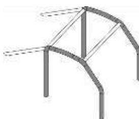
2 arcos laterais 2 membros transversais 2 apoios traseiros (backstays)